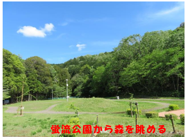
蛍流公園から森を眺める

森の木々が芽吹き、濃い緑、薄い緑、黄緑など、山々の様々な緑が目染みる季節になってきました。また、森では鳥の鳴き声がひびき、ホタルの里の沢ではメダカやオタマジャクシ、金魚たちが泳ぎまわるなど、森の生き物たちが生き生きと動き始めました。ちせい坂では、サルの集団まで目にしました。