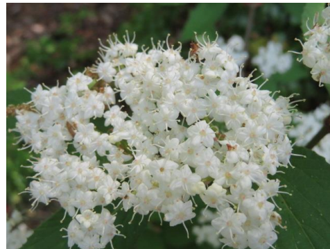
コバノガマズミの花