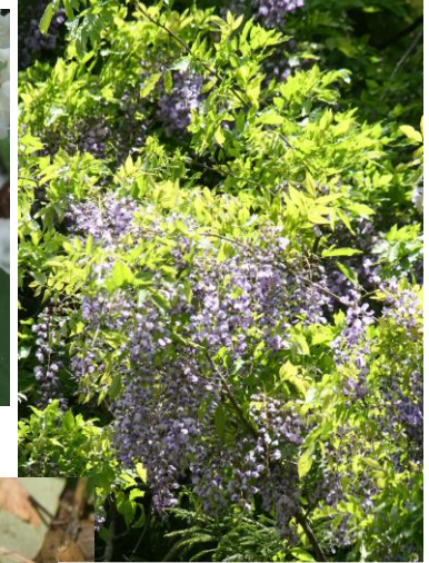
ホタルの里付近の山藤