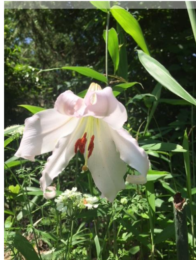
一輪咲いていたササユリ