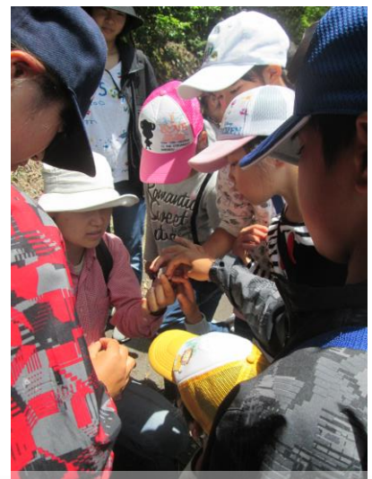
トカゲを触りながら観察