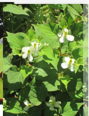
ドクダミの花 (ホタルの里で)