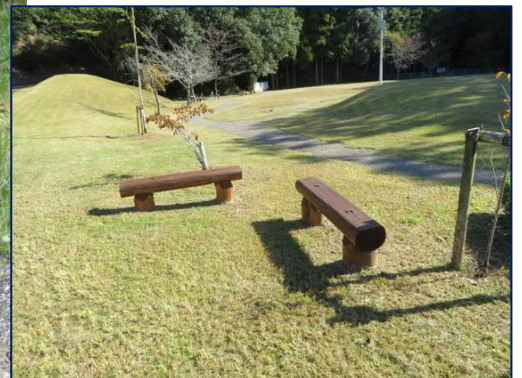
草刈りを終えてきれいになっ た蛍流公園 (10月30日)