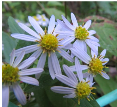
ホタルの里に群 れ咲くシロヨメナ