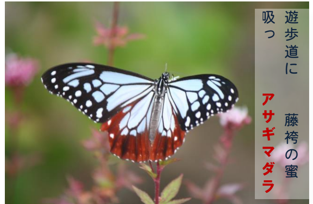
遊歩道に アサギマダラ 吸っ 藤袴の蜜