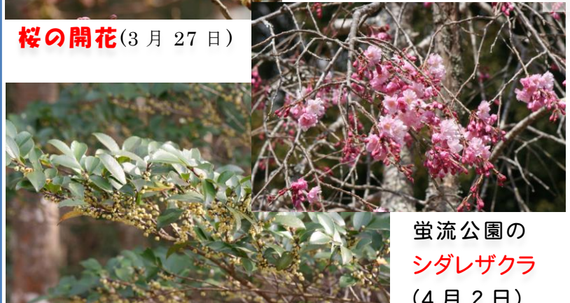
螢流公園の シダレザクラ (4月2日)