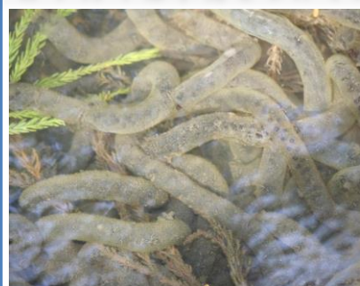
カエルの卵がいっぱい (ホタルの里3月20日)