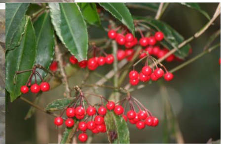
ホタルの里の奥で赤く輝いていたマンリョウの実(4月2日)