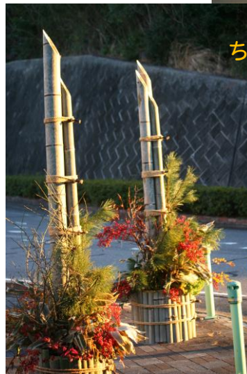
朝日を浴びる門松 (清流の会有志制作)