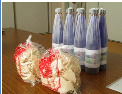
天使の舞、完売です。