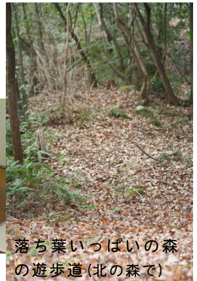
落ち葉いっぱいの森の遊歩道(北の森で)