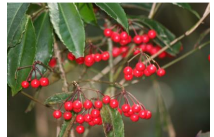
ホタルの里のマンリョウ